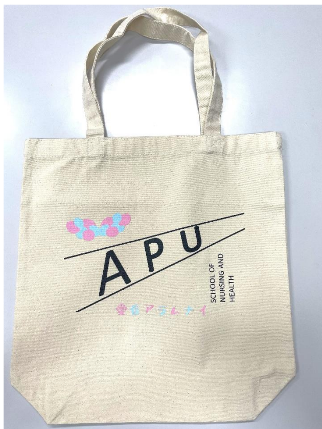
製作した、愛看アラムナイトートバック (実物)